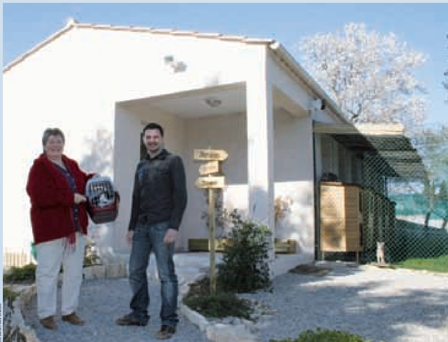
Le Jardin des Chats®